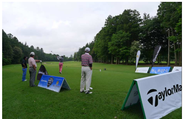
『ジャパン・ホワイト・ツアー』の様子

アマチュアモニター1000名の声 http://tm-gloire.jp/product/index.html