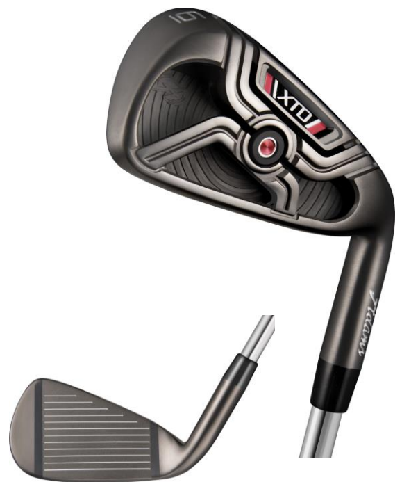
『XTD アイアン』 (2014年3月中旬より販売開始)

また安定性を向上するヘッド設計として「クロスキャビティデザイン」、「ウレタン樹脂」、そしてアダムス鑄造アイアン史上最も薄肉の「高強度450SS薄肉フェース」を採用。「クロスキャビティデザイン」によって重心位置を深くしたことで、慣性モーメントが向上するため、ヘッドの無駄な動きを抑制します。「ウレタン樹脂」では、インパクト時の衝撃・振動を吸収し、ヘッドのブレを軽減します。そして「高強度450SS薄肉フェース」により、高いフェース反発力と低重心を生み出し、無駄なスピンを減らすことで、ロフト角を立て過ぎることなく強く高い弾道を実現しました。