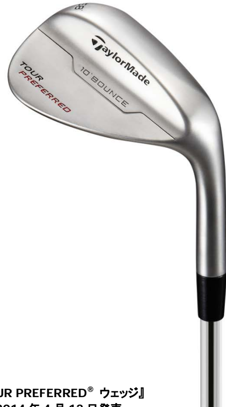
『TOUR PREFERRED® ウェッジ』 2014年4月12日発売

また、抜けがよくヘッドコントロールしやすいソールデザインを採用したことで、スムーズな振り抜きを導くと同時に、フェースを最大限に開いてもインパクト時におけるヘッドの跳ねを抑制、ロブショットなど多彩なショットテクニックを生かしやすい設計が施されています。