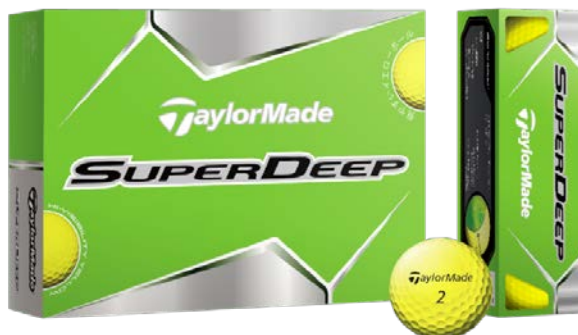
『SUPERDEEP ボール』 <(右)イエロー> (2013年2月発売予定)