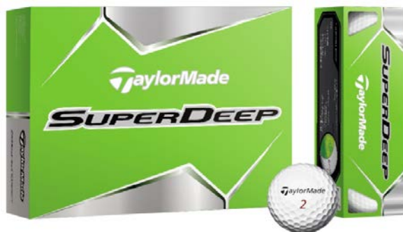
『SUPERDEEP ボール』 <(左)ホワイト> (2013年2月発売予定)

『SUPERDEEP ボール』では、オーソドックスなホワイトカラーに加えて、イエローカラーをラインナップ。高い飛距離性能を兼ね備えたハイパフォーマンスをリーズナブルなプライスで提供します。