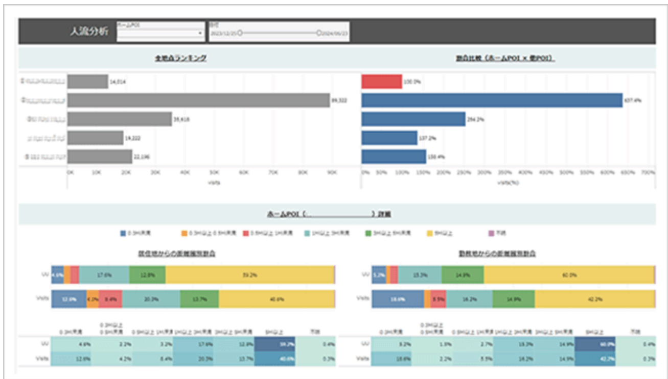
インバウンドデータを活用した海外市場の人流分析レポート

全世界で約42億IDの匿名加工された位置情報ビッグデータを活用し、海外市場や日本国内における訪日外国人の移動パターンや行動傾向を高精度で把握できるサービスを提供しています。また、海外市場における人流分析にも対応し、企業のグローバルなマーケティング活動を支援します。