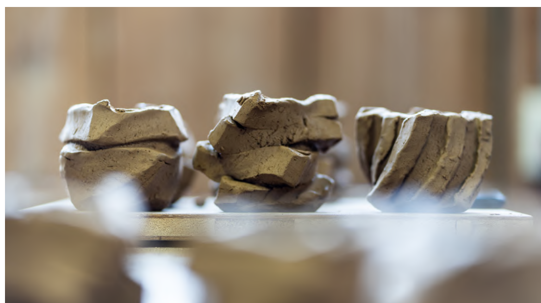
笹間村の夕日（左上）と工房で撮影された作品