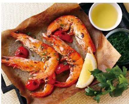
グリルシュリンプセット 580円(税込)