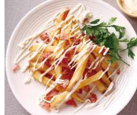
新メニュー アイオリベーコンポテト 500円(税込)

アイオリベーコンポテト& Chorizoセット 680円(税込) ※合計1,000円(税込)*が 320円お得!