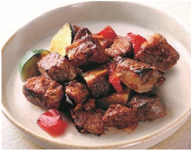
新メニュー 牛ステーキのグリル 980円(税込)

牛ステーキのグリルセット 780円(税込) ※単品980円(税込)が 200円お得!