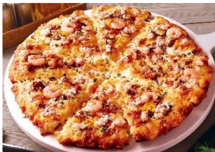
ウインタークラブ

ピザーラでカニのピザが味わえるのは冬だけのおたのしみ！【ピザーラ感謝祭】のお得な期間に、ぜひお試しください。