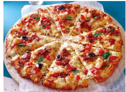
地中海シーフード

夏の新メニューの登場と共に、春の新作ピザ『とろけるビーフとマスカルポーネ』など、この春の季節限定メニューが販売終了となります。たくさんのご愛顧をありがとうございました。