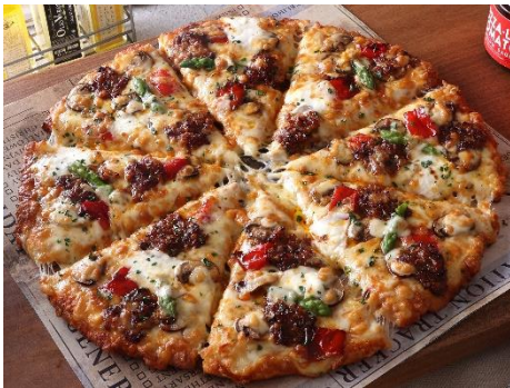
とろけるビーフとマスカルポーネ