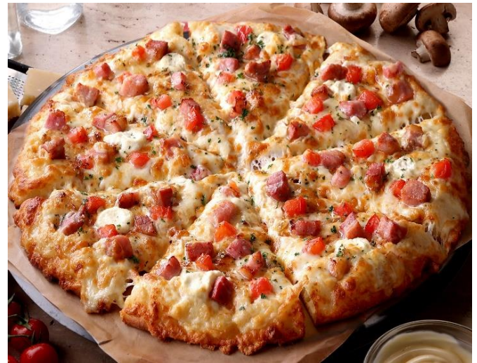
『熟成パンチェッタと瀬戸内レモンソース』 6月20日(木)発売 P:2,280円/M:2,680円/L:4,300円

『熟成パンチェッタと瀬戸内レモンソース』をラインナップしたクォーターピザなど、他にも夏らしい新作が続々登場します、ぜひご期待ください。