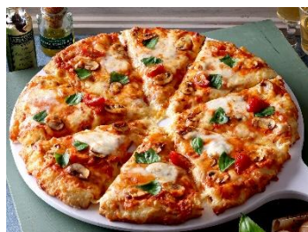
フレッシュマッシュルームのマルゲリータ ～トマトクリーム仕立て～

イタリア産水牛モzzarellaを使用し、生ハムの旨みとほどよい塩味、トマトの酸味が調和する特製トマトクリーム仕立てのスペシャルなマルゲリータです。