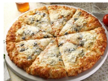
クアトロフォルマッジ

濃厚でミルクィなイタリア産水牛モzzarellaと、芳醇な香りの国産マッシュルームが絶妙に絡み合う、特製トマトクリーム仕立てのマルゲリータ。