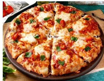
水牛モzzarellaの プレミアムマルゲリータ

イタリア産ポットルガ(からすみ)の芳醇な香りと、プリプリとした大海老、特製アリオソースの旨みが口いっぱいに広がる、贅沢なシーフードピザです。