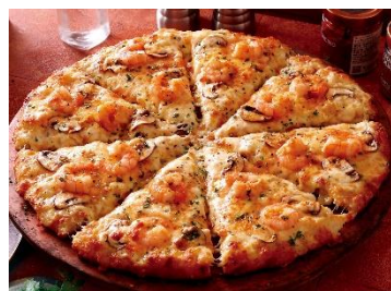
ポットルガと大海老の 贅沢シーフード

本場イタリア産ゴルゴンゾーラをはじめとした4種のチーズの濃厚なコクに、厳選したハチミツのやさしい甘みが重なり合う、塩味と甘みのバランスが魅力の一品です。