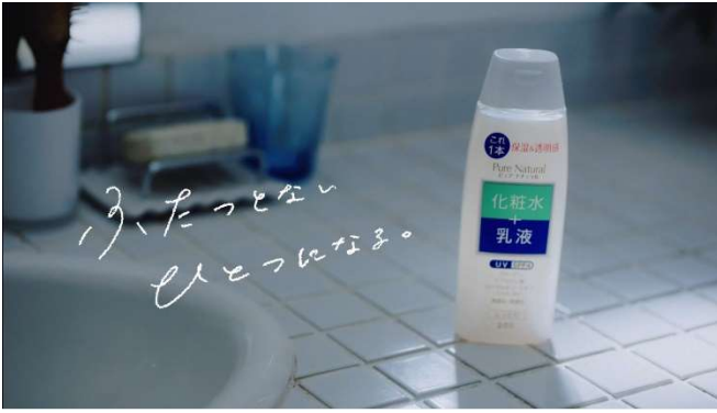
「ふたつとない、ひとつになる。ピュア ナチュラル」