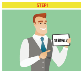
専用ページに登録