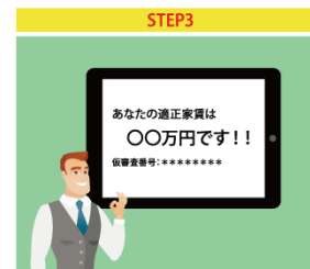
お客様に適正な家賃をお知らせし、仮審査番号を発行いたします