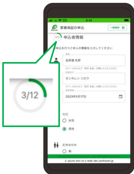
<申込画面イメージ> 進行度の確認も可能です