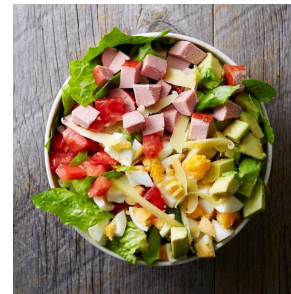
ダウントウン・コブ 1,524円