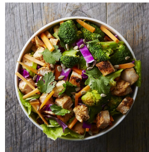
スパイシー・バイマイ 1,194円