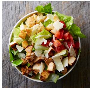
クラシック・チキンシーザー 1,084円