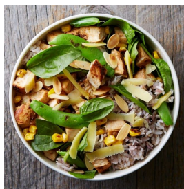
ファームボウル 1,247円