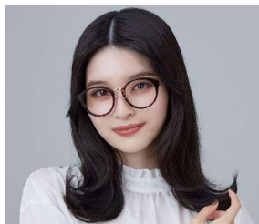
ミーティング前に髪美人 外ハネ作り