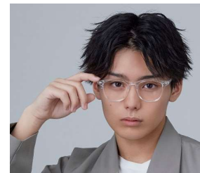
カフェで手早く 外ハネ演出