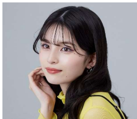
デート前に シースルーバングも元通り