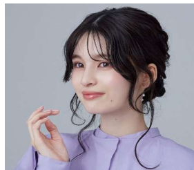
おしゃれ感アップの おくれ毛は学校で