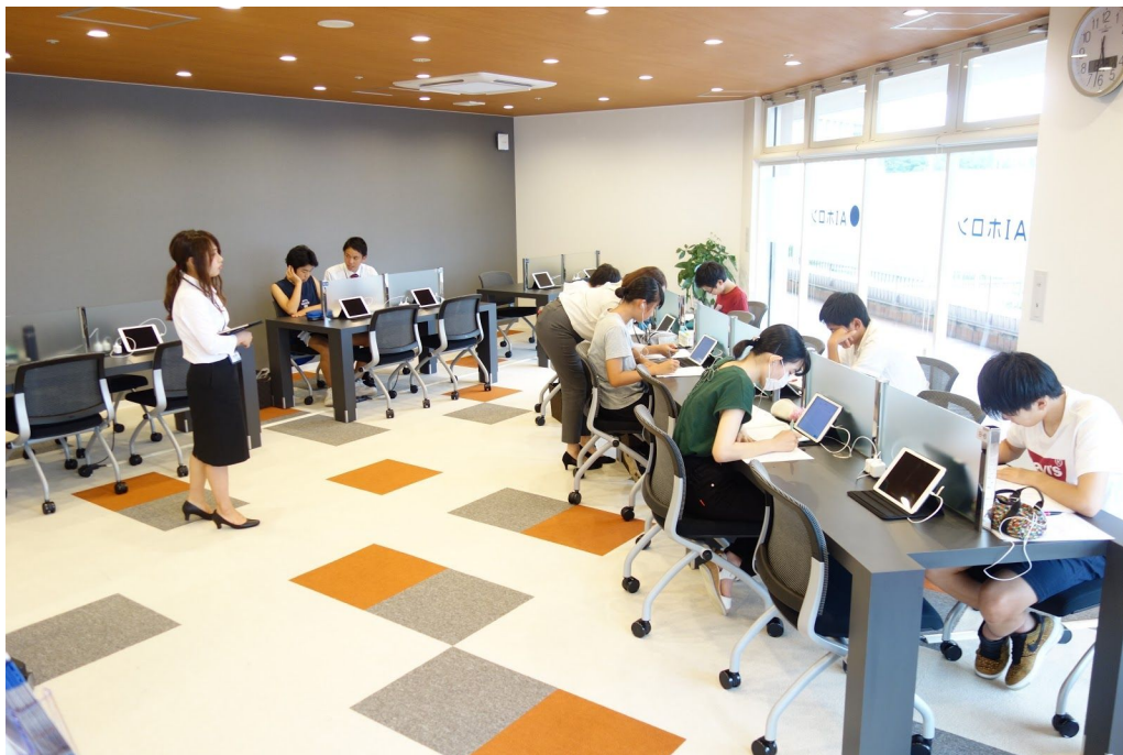
(AIホロンにて、『atama+』を活用し勉強する生徒と講師の様子)

なお、2018年1月に実施したトライアルでは、高校生83人が『atama+』を用いて約20時間数学1Aを勉強した結果、センター試験の平均点数が37.3点から51.7点にアップしました。