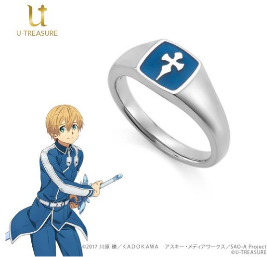
エンブレムモチーフリング（ユーゾウ）