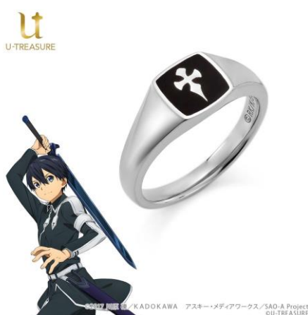
エンブレムモチーフリング（キリト）