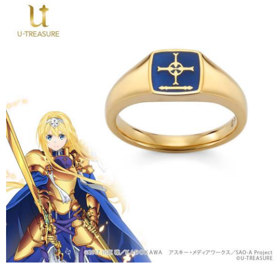
エンブレムモチーフリング（アリス）