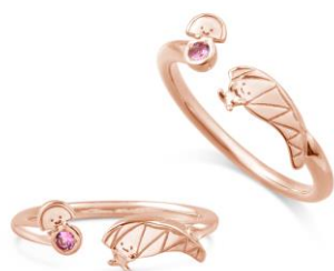
ピントルマリンがアクセントに