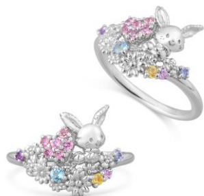
カラーストーンをたくさん留めて カラフルなデザインに