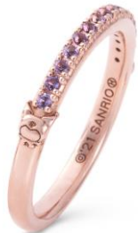
左サイドにはクロミのシルエット

税込価格・素材：24,200円（シルバー（ピンクゴールドコーティング））、110,000円（K18ピンクゴールド）