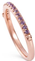
右サイドにはどくろ