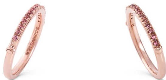
左サイドにはマイメロディのシルエット

税込価格・素材：24,200 円（シルバー（ピンクゴールドコーティング））、110,000 円（K18 ピンクゴールド）