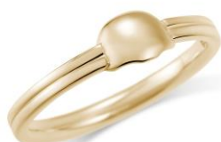
モチーフリング（鶴見篤四郎） K10イエローゴールド