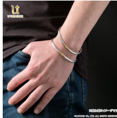
着用イメージ（重ね付け）