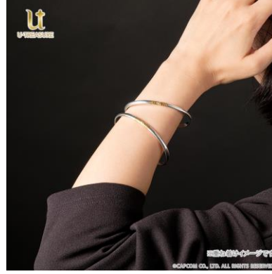
着用イメージ（重ね付け）