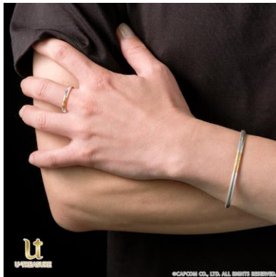
着用イメージ（リング別売）