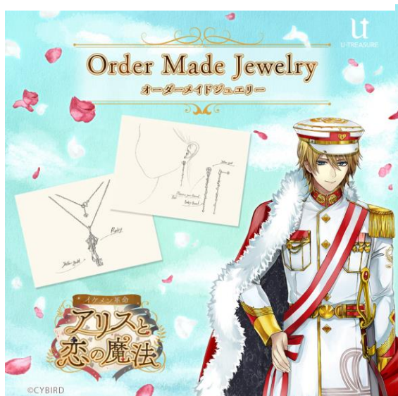
イケメン革命◆アリスと恋の魔法