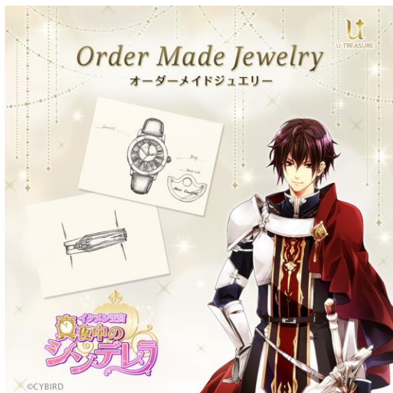
イケメン王宮◆真夜中のシンデレラ