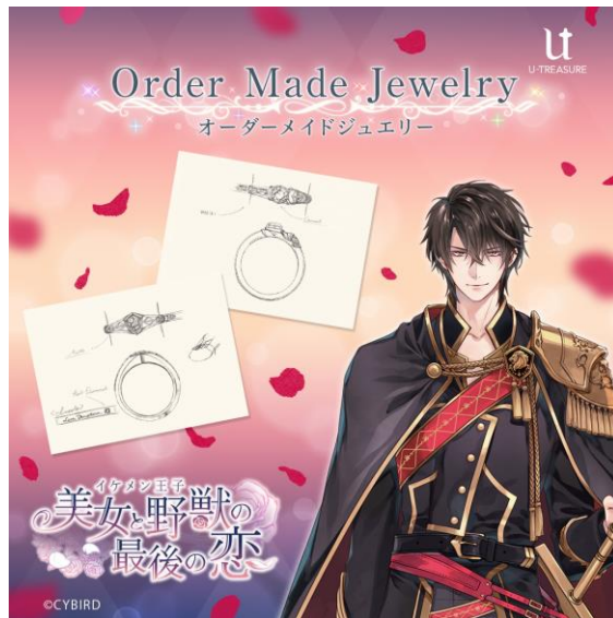
イケメン王子 美女と野獣の最後の恋

<本件に関する報道機関からのお問い合わせ先> 株式会社ユートレジャー 広報/担当: 田中 press@u-treasure.jp, 080-7005-3684 ※報道関係者向けに商品の貸出しを行なっております。