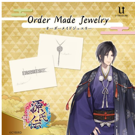
イケメン源氏伝 あやかし恋えにし