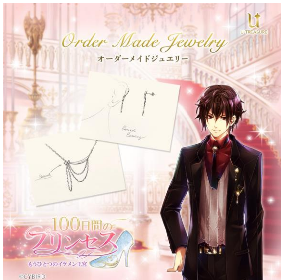
100 日間のプリンセス◆もうひとつのイケメン王宮