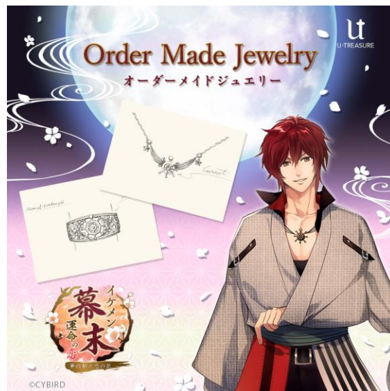
イケメン幕末◆運命の恋

＜本件に関する報道機関からのお問い合わせ先＞ 株式会社ユートレジャー 広報/担当：田中 press@u-treasure.jp , 080-7005-3684 ※報道関係者向けに商品の貸出しを行なっております。