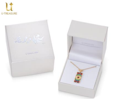
ロゴ入りボックスに入れてお届けします