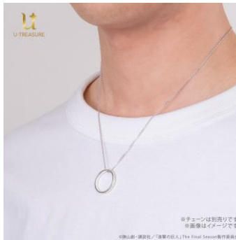
シルバー-925 着用イメージ （ネックレスチェーン別売り）