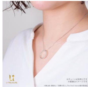
シルバー-925 着用イメージ （ネックレスチェーン別売り）