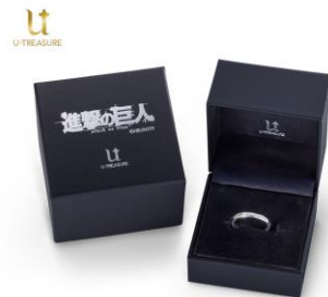
ロゴ入りのボックスに入れてお届けします