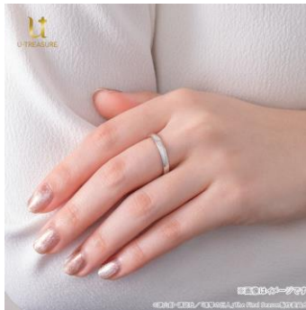
シルバー-925 着用イメージ