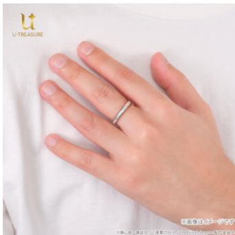
シルバー-925 着用イメージ