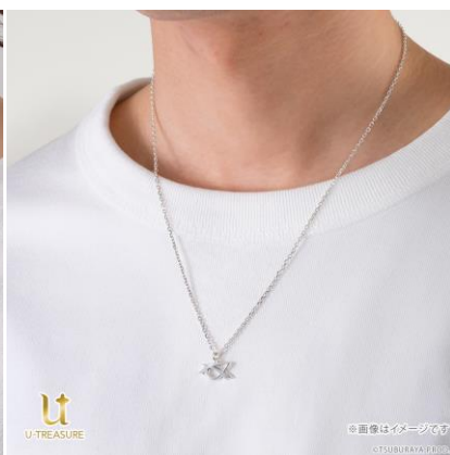
シルバー925 着用イメージ