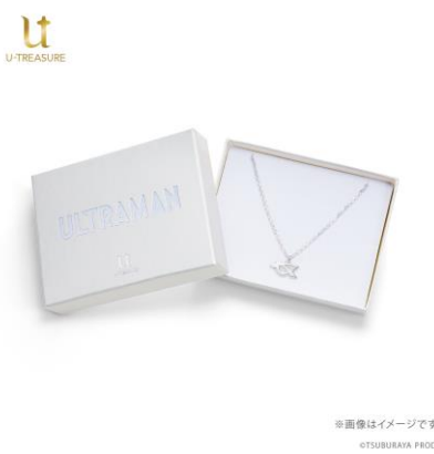
ロゴ入りボックスに入れてお届けします