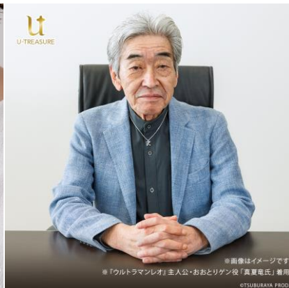
シルバー925 着用イメージ