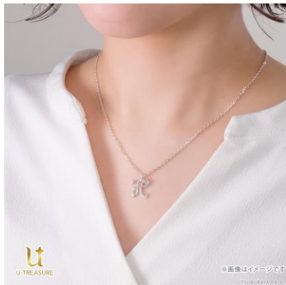
シルバー925 着用イメージ