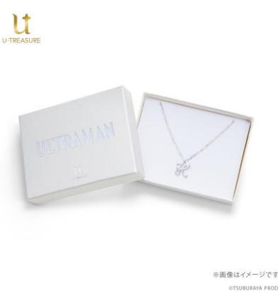
ロゴ入りボックスに入れてお届けします