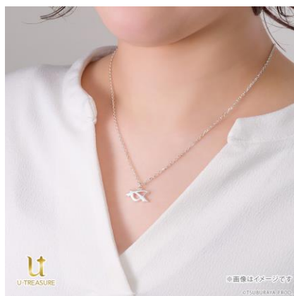
シルバー925 着用イメージ