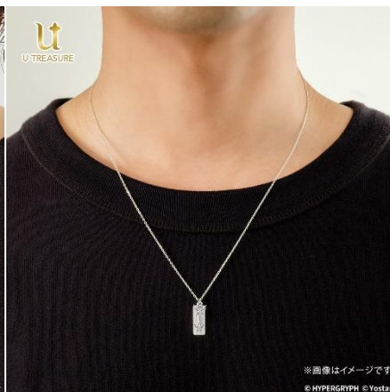
シルバー925 着用イメージ

＜本件に関する報道機関からのお問い合わせ先＞ 株式会社ユートレジャー 広報／担当：田中 press@u-treasure.jp、03-5315-0883 ※報道関係者向けに商品の貸出しを行っております。