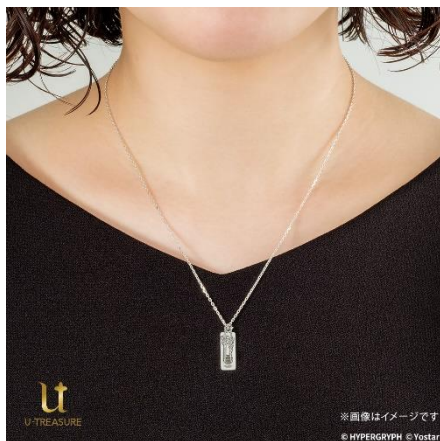
シルバー925 着用イメージ