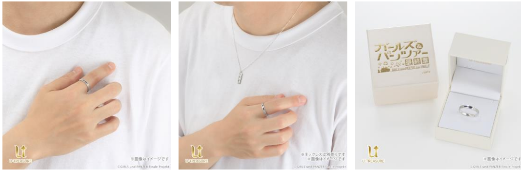
同時発売のネックレスと併せての着用イメージ ログ入りのボックスでお届けします

【ガールズ&パンツァー 最終章】とコラボレーションした、「プレートネックレス」も同期間中（2026年1月20日（火）～2026年2月20日（金））予約を受け付けております。