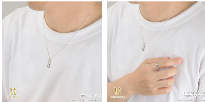
同時発売のリングと併せての着用イメージ

【ガールズ&パンツァー 最終章】とコラボレーションした、「履帯モチーフリング（指輪）」も同期間中（2026年1月20日（火）～2026年2月20日（金））予約を受け付けております。