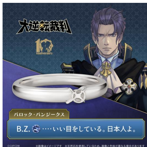
「バロック・バンジークス」モデル