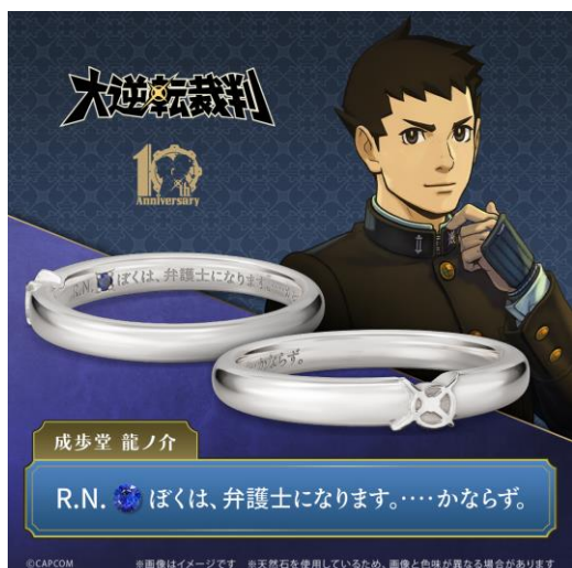
「成歩堂 龍ノ介」モデル