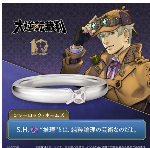
「シャーロック・ホームズ」モデル