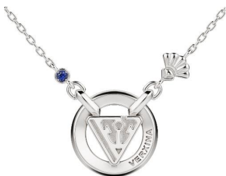
※画像はイメージです ※天然石を使用しているため、画像と色味が異なる場合があります