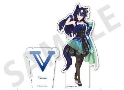
【特典】アクリルジュエリースタンド