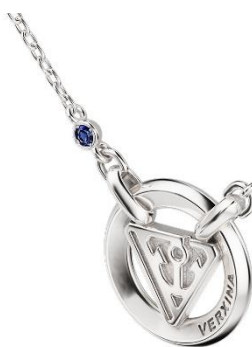
※画像はイメージです ※天然石を使用しているため、画像と色味が異なる場合があります