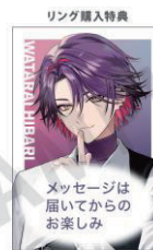
リング購入特典 撮り下ろしビジュアルを使用した複製メッセージ付きポストカード 1点購入につき、1枚プレゼント ※画像はイメージです