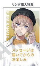
リング購入特典 撮り下ろしビジュアルを使用した複製メッセージ付きポストカード 1点購入につき、1枚プレゼント ※画像はイメージです ©ANYCOLOR, Inc.