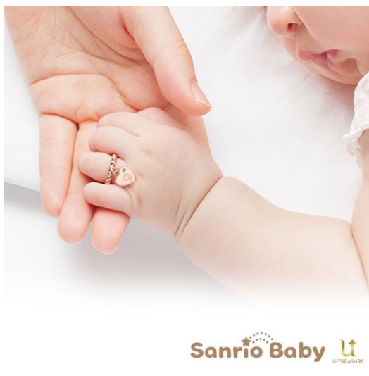
身につけて記念写真を撮るのも素敵