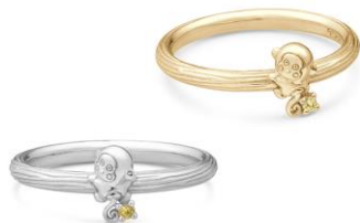
バナナに見立てた天然石のイエローサファイアを落とさないようにしっかりと持って…