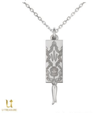
衣装の裏地デザインを施した裏面