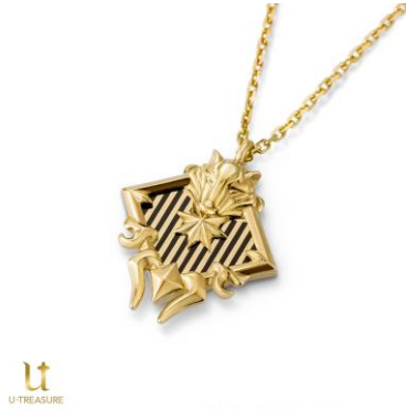
キサラ ネックレス

税込価格・素材：14,300 円（シルバー（イエローゴールドコーティング））、110,000 円（K18 イエローゴールド）