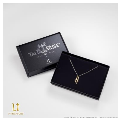
専用 BOX でお届け（6 種類共通）