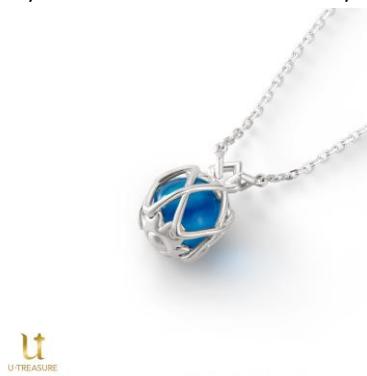
リンウェル ネックレス

税込価格・素材：14,300 円（シルバー）、110,000 円（K18 ホワイトゴールド）