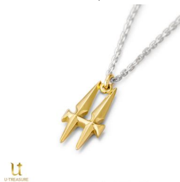
アルフェン ネックレス

税込価格・素材：14,300 円（シルバー（イエローゴールドコーティング））、88,000 円（K18 イエローゴールド）