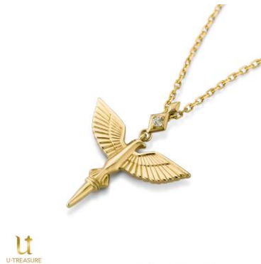
テュオハリム ネックレス

税込価格・素材：14,300 円（シルバー（イエローゴールドコーティング））、88,000 円（K18 イエローゴールド）