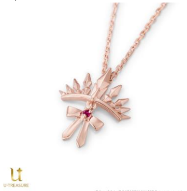
シオン ネックレス

税込価格・素材：14,300 円（シルバー（ピンクゴールドコーティング））、88,000 円（K18 ピンクゴールド）