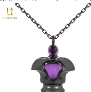
ダークオーブ ネckレス

【劇場版 魔法少女まどか☆マギカ[新編]叛逆の物語】ダークオーブ ネckレス ほむらのソウルジェムが感情の極みにより再構築された紫色の宝石「ダークオーブ」をモチーフとしたネックレス。日常使いしやすいサイズ感で、立体的にジュエリーへ表現し、底面には悪魔ほむらの象徴的な紋章を刻印しました。 税込価格・素材：17,600円（シルバー（ブラックコーティング））