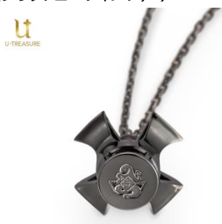
底面には悪魔ほむらの象徴的な紋章を刻印