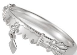
モチーフリング（イラストリアス）