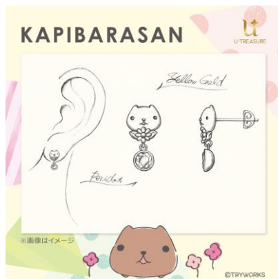
ピアスデザイン例