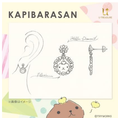
ピアスデザイン例