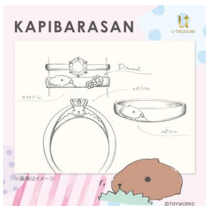
婚約指輪・結婚指輪デザイン例