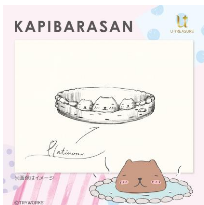
リングデザイン例