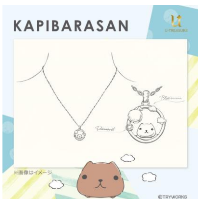
ネックレスデザイン例