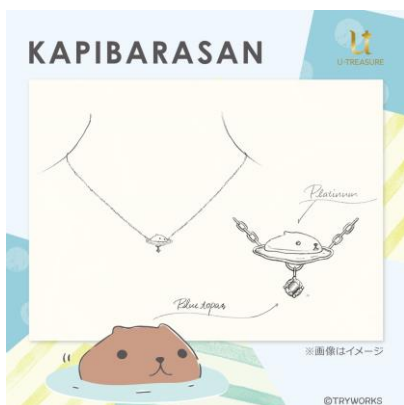
ネックレスデザイン例