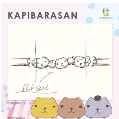
リングデザイン例