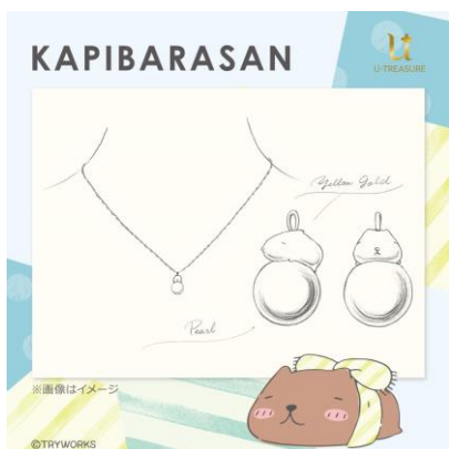
ネックレスデザイン例