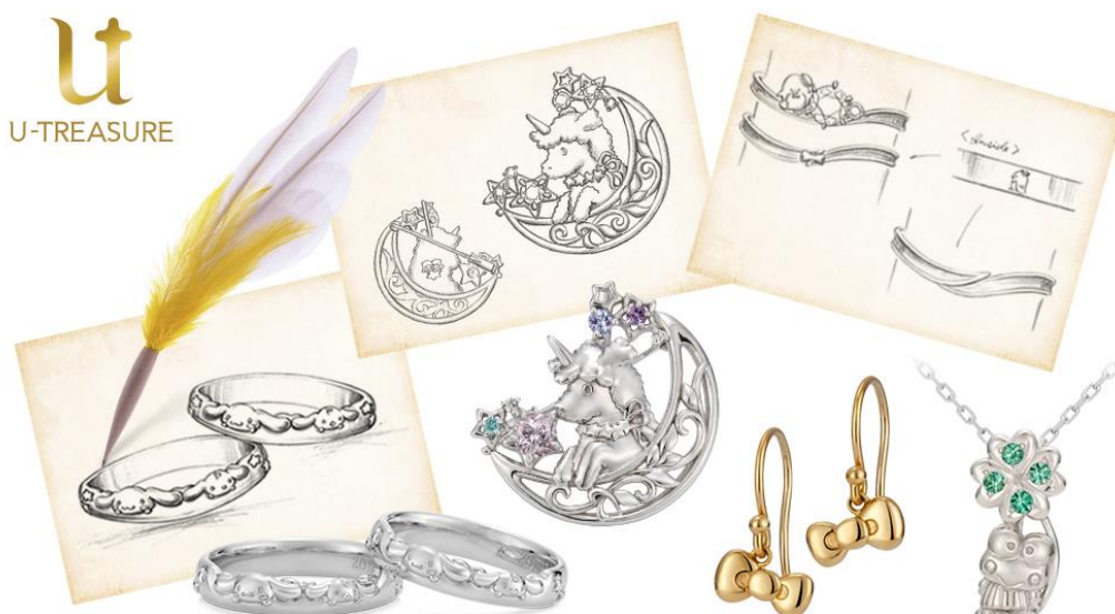
サンリオキャラクターズのオーダーメイドジュエリー（デザイン画・参考商品）

大人のための本格的なキャラクタージュエリー・グッズなどを扱うユートレジャーは、株式会社サンリオのキャラクターをモチーフにしたオーダーメイドジュエリーをWEB上でデザイン提案～注文、発送まで対応する「オンライン注文窓口」を4月14日（火）からサービス開始します。 https://www.u-treasure-onlineshop.jp/event-news/sanrio202004/ 新型コロナウイルスの感染拡大防止のため、外出の自粛が要請されていることから、自宅でオーダーメイドジュエリーを検討、注文する方法としてサービスを展開します。希望のアイテムやキャラクターなどを専用フォームから申込後、専属のデザイナーが要望にあわせてデザイン画を描き提案します。（デザイン提案・見積まで無料）