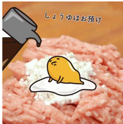
大好物のしょうゆはお預け