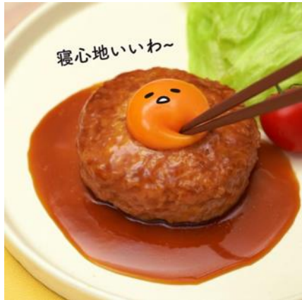
「つくねバーグ寝心地いいわ～」

「ぐでぐでとろける～チーズインぐでたまつくねバーグ」のレシピ動画は、「つくねバーグ寝心地いいわ～」の声とともに、割れたぐでたま(生たまご)がソースと絡み、つくねバーグの中のチーズがとろーりとろける「シズル感」満載のシーンから始まります。