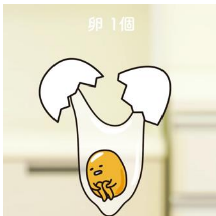
ポウルの上で割られたぐでたま

ひき肉入りのポウルの上でたまごを割ると、ぐでたまが現れ、ひき肉にダイブ。途中しょうゆに気を取られたり、お預けを喰らったりしますが、「案外、大事な役割なんだわ～」とたまごの価値を語りながら、ひき肉と混ぜられていきます。チーズを包んで、フライパンへ。フタをあけると、つくねバーグにもぐでたまの顔が現れ「そろそろ、食べごろなんだわ～」の声が。火の通ったぐでたまつくねバーグはお皿に盛り付けられ、最後はぐで生たまごとしてトッピングされ完成です。