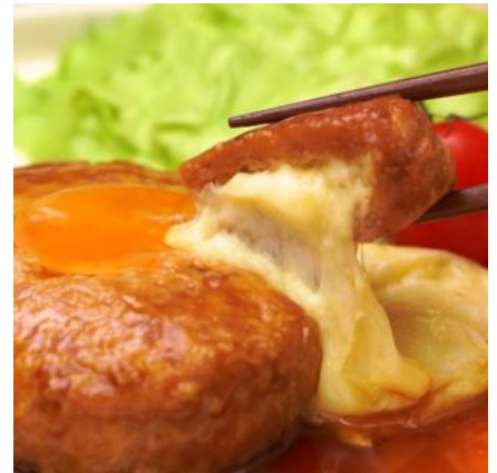
つくねバーグの中からとろーりとろけるチーズ

ひき肉入りのポウルの上でたまごを割ると、ぐでたまが現れ、ひき肉にダイブ。途中しょうゆに気を取られたり、お預けを喰らったりしますが、「案外、大事な役割なんだわ～」とたまごの価値を語りながら、ひき肉と混ぜられていきます。チーズを包んで、フライパンへ。フタをあけると、つくねバーグにもぐでたまの顔が現れ「そろそろ、食べごろなんだわ～」の声が。火の通ったぐでたまつくねバーグはお皿に盛り付けられ、最後はぐで生たまごとしてトッピングされ完成です。