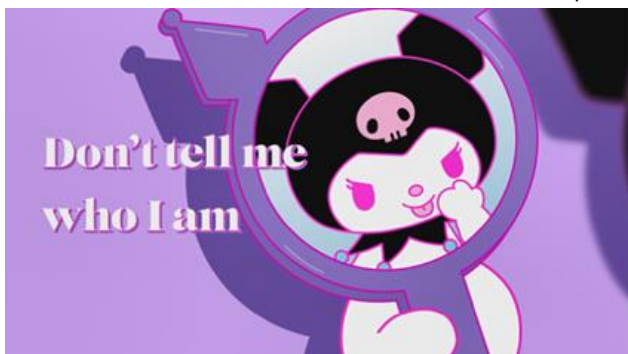
『Greedy Greedy English ver.』