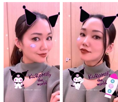
AR フィルターイメージ

クロミの Instagram アカウント (@kuromi_project) を AR 対応のスマホで開き、フィードの上のマークをタップし、AR フィルターを選択。 試すボタンから AR フィルターを起動し、撮影ができます。