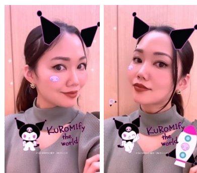
AR フィルターイメージ