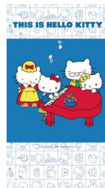
ハローキティ動画アカウント This is hello kitty.での投稿イメージ