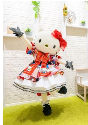
ハローキティ50周年記念新衣装

アイドル・タレント・アーティストの衣装制作・スタイリング・ヘアメイクなどを行うクリエイティブ企業。AKB48の結成時から衣装・ヘアメイクを手掛け、メンバーの個性を引き出す豊富な衣装デザインとバリエーションに定評がある。近年では、学校制服ブランド「O.C.S.D.」や医療制服ブランド「O.C.M.D.」、ゲームキャラクターの衣装デザインなど、多岐に渡り活動の幅を広げている。