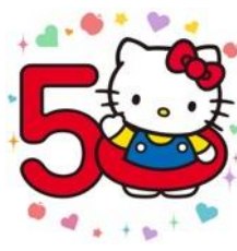
「いいね」すると、 現れるアニメーションイメージ