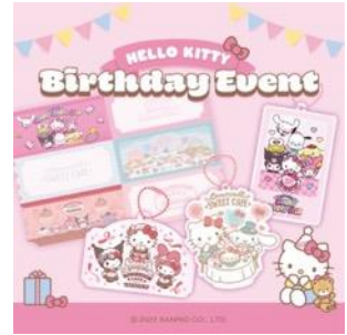
カフェのバースデーイベント