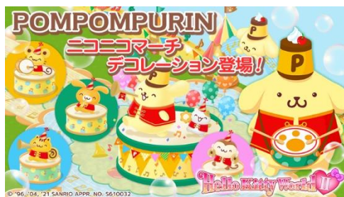
ニコニコマーチデザイン連動アイテム(一部)

さらに、箱庭ゲームアプリ『ハローキティワールド 2』では商品発売に合わせて4月に、期間限定でポムポムプリン「ニコニコマーチデザイン」シリーズとの連動企画を実施します。実際に発売される商品が、箱庭を装飾するアイテムとなって登場! リアルグッズだけでなく、ゲームアプリ内でも、記念デザインのグッズを集めて楽しむことができます。