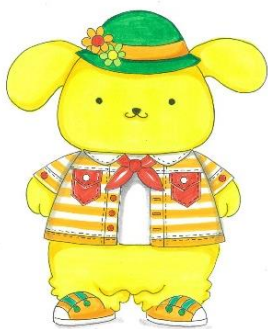
新コスチューム (イメージ)

大分県日出町のサンリオキャラクターパーク ハーモニーランド(以下、ハーモニーランド)でも、2021年4月1日(木)~12月31日(金)の期間、「元気いっぱい! のびのび! プリン」をテーマに、ポムポムプリン 25周年アニバーサリーイベントを開催いたします。