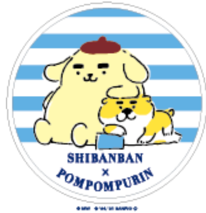
オオゴシヤステル描き下ろしデザイン (一部)