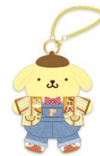
マスコット(発売日未定) ¥2,750 ※画像はイメージです