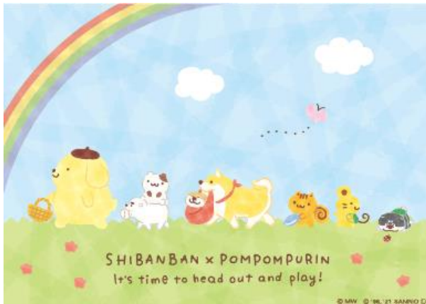
サンリオ描き下ろしデザイン 虹 (一部)