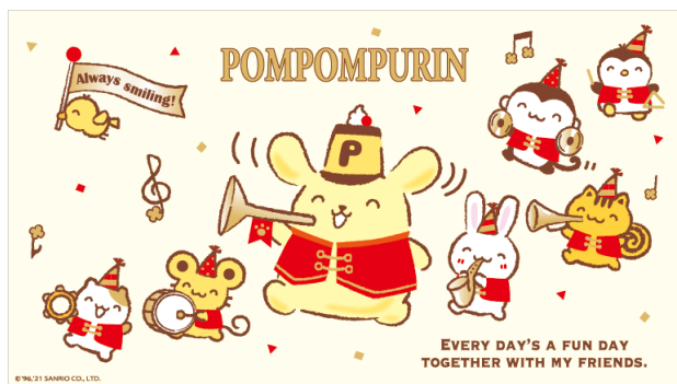
ニコニコマーチデザイン

このデザインの商品は「ニコニコマーチデザイン」シリーズとして、全国のサンリオショップ、百貨店のサンリオコーナーおよび、サンリオオンラインショップにて、4月中旬より発売します。商品ラインアップは、ぬいぐるみや小物入れ、エコバッグなどの全16商品を予定。詳細は4月上旬頃、サンリオホームページにてお知らせします。