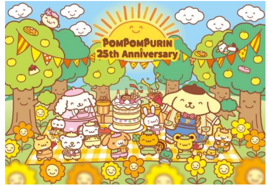
サンリオピューロランド 「POMPOMPURIN 25th Anniversary “にこにこ”プリンパーティ with チームプリン」 キービジュアル

サンリオピューロランド(以下、ピューロランド)では、2021年3月12日(金)～12月31日(金)の期間、ポムポムプリン 25周年アニバーサリーイベント「POMPOMPURIN 25th Anniversary “にこにこ”プリンパーティ with チームプリン」を開催します。ポムポムプリンとおともだちキャラクターのフотスポットが楽しめるアニバーサリーエリア「にこにこプリンルーム」や限定のグッズ、フードメニュー、オンライン企画など様々なお楽しみコンテンツを1年間を通してお届けします。今回はポムポムプリンのおともだち、マフィンがポムポムプリンと一緒にピューロランドに初登場！さらに、アニバーサリーを記念した新コスチュームも登場。にこにこプリンルームで実施予定のスペシャルグリーティング(有料)で間近で見られるチャンスも。25周年にちなんだ、“にこにこ”な笑顔いっぱいのお楽しみイベントをお楽しみください。