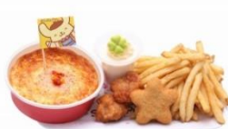
プリン 25周年☆ ずわいかにドリアコンビプレート ¥1,700