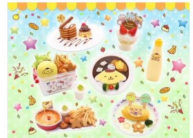
限定フード&スイーツメニュー(イメージ)

他にも、おともだちキャラクターも“にこにこ”なオムライスや、食べながらの記念撮影にもぴったりな飲むプリン、パンケーキが5枚積み重なったパンケーキタワープレートなど、様々なフード&スイーツメニューが登場します。ポムポムプリンの世界観を感じられるかわいいメニューをお楽しみください。