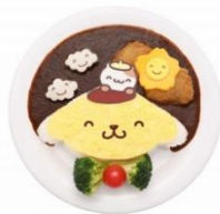
にこにこプリンのロスカツカレー ¥1,400