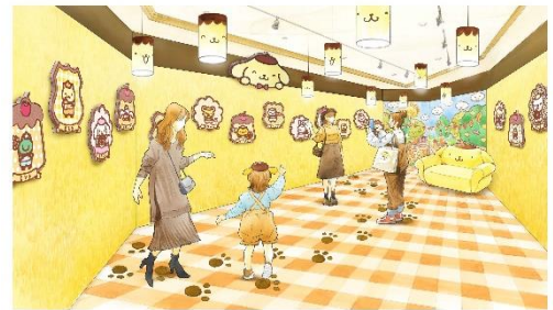
にこにこプリンルーム(イメージ)

また、ポムポムプリンを1分間独占出来る「ポムポムプリン 25周年スペシャルグリーティング(有料)」も「にこにこプリンルーム」にて期間限定で実施。ポムポムプリンでいっぱいの空間で、ポムポムプリンとの時間をお過ごしいただけます。