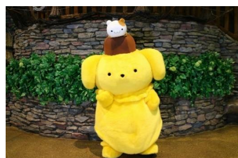
右：ポムポムプリンと一緒にマフィンが初登場