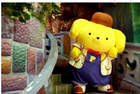
左：アニバーサリーを記念した新コスチューム

※「ポムポムプリン 25周年スペシャルグリーティング(有料)」の詳細は決まり次第、サンリオピューロランドのホームページでお知らせします。