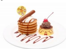
プリンのパンケーキタワープレート ¥1,000