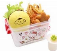
プリン 25周年☆ 照りマヨバーガーバスケット ¥1,700