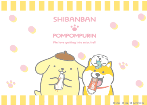
サンリオ描き下ろしデザイン いたずら (一部)

SNSを中心に人気のキャラクター「しばんばん」の5周年と、ポムポムプリン25周年を記念して、コラボレーションが決定！しばんばん作者オオゴシヤステルによる描き下ろしデザインに加え、サンリオでも3種類のデザインを描き下ろしました。癒し系犬キャラクターという共通点を持つしばんばんとポムポムプリン。ポムポムプリン公式 Twitter でも、明日1月19日(火)の投稿を皮切りに、みんなでのんびり仲良く過ごす様子を随時展開予定です。