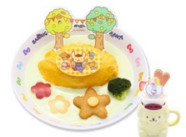
にこにこプリンパーティ♪オムライス (キャラクターデザートカップ付き) ¥1,670