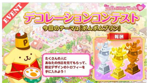
ハローキティワールド 2 デコレーションコンテスト

さらに、箱庭ゲームアプリ『ハローキティワールド 2』では商品発売に合わせて4月に、期間限定でポムポムプリン「ニコニコマーチデザイン」シリーズとの連動企画を実施します。実際に発売される商品が、箱庭を装飾するアイテムとなって登場! リアルグッズだけでなく、ゲームアプリ内でも、記念デザインのグッズを集めて楽しむことができます。