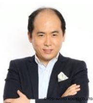
斎藤司 (トレンディエンジェル)