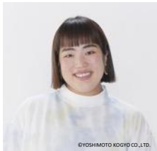
ゆりやんレトリバア