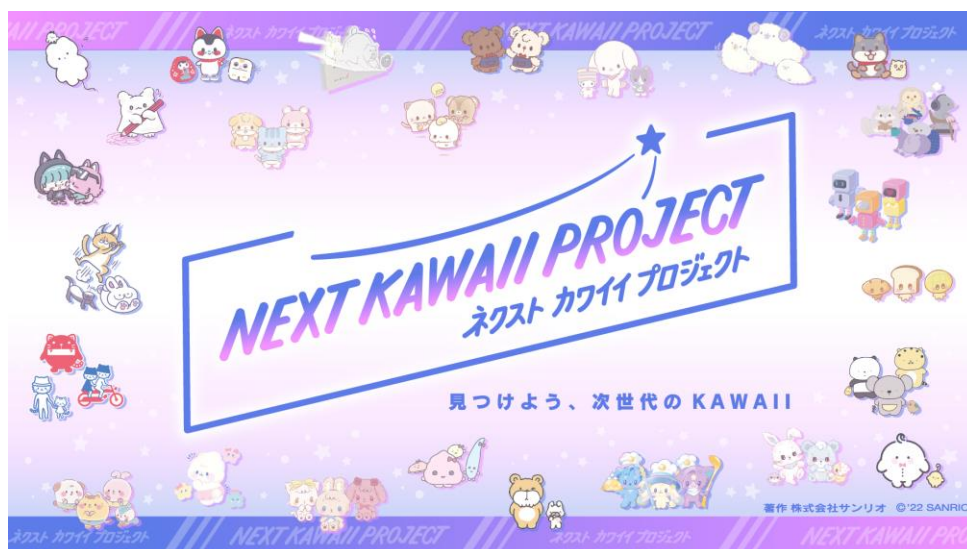
「NEXT KAWAII PROJECT」 キービジュアル

株式会社サンリオ(本社：東京都品川区 代表取締役社長：辻 朋邦、以下サンリオ)は、サンリオの次にデビューする新キャラクターを決めるユーザー参加型プロジェクト「NEXT KAWAII PROJECT (ネクストカワイイプロジェクト)」を、本日6月10日(金)より開催いたします。段階的に行われるユーザー投票において、来年1月頃に実施予定の最終投票「STEP3」を1位で勝ち抜いたキャラクターは、商品化し、サンリオの新キャラクターとして本格的にデビューいたします。