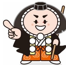
▲小松市イメージキャラクター「カブッキー」