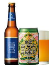
KANAZAWA Pale Ale