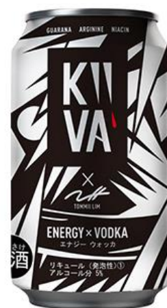
KiiVA ENERGY VODKA 製品イメージ

「KiiVA ENERGY VODKA」プロモーションムービー(30秒 ver) YouTube URL : https://youtu.be/XPPIVpFfcXI