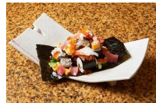
東京駅限定メニュー 海鮮極み盛り ～令和(2020)～

HIGHBALL BAR 東京駅1923 (東京グルメゾーン) 1,364円 (税抜)