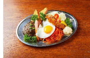
大人様ランチ (レギュラー)

HIGHBALL BAR 東京駅1923 (東京グルメゾーン) 1,364円 (税抜)