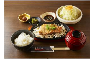
黒豚のステーキ定食

URL: https://www.tokyoeiki-1bangai.co.jp/15thanniversary/