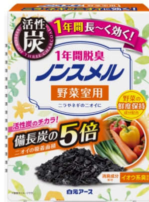
ノンスメル置き型 1年間脱臭 冷蔵庫用 / 冷凍室用 / 野菜室用